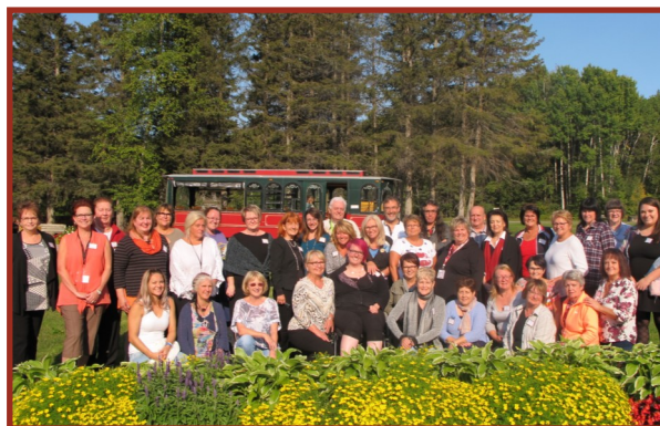
Participants et organisateurs 2017 - 20ème édition

Veillez joindre votre paiement avec cette fiche d'inscription